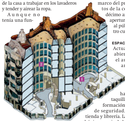
▶▶ Planta de la Pedrera, en la nueva guía visual.